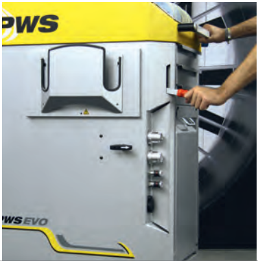
Handbremse – zur kompletten Lenkrollen-Feststellung