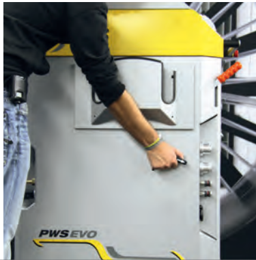
Umschalter für den Duo-Sauganschluß