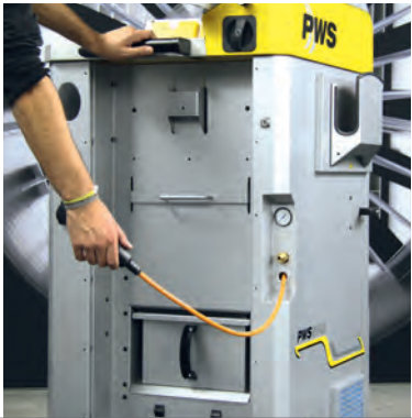
Integrierter Kabelaufroller mit 6 Meter Industriekabel