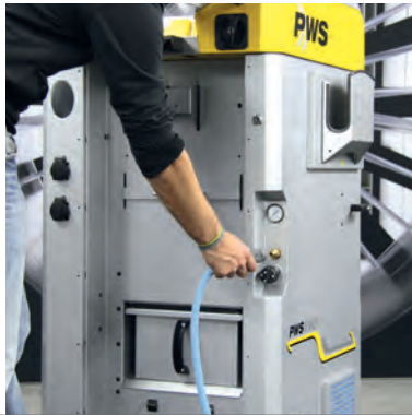
Anschluss für die Druckluftversorgung