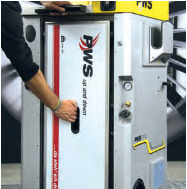
Up and Down – integrierter, herausnehmbarer Klappauftritt