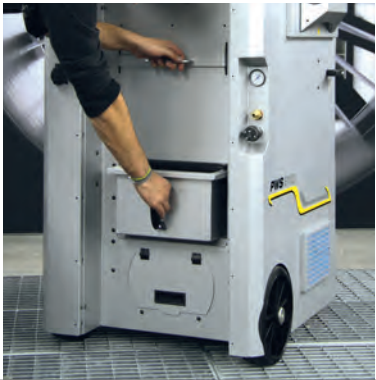
Herausnehmbarer 10 Liter Staubbehälter zur einfachen Entleerung