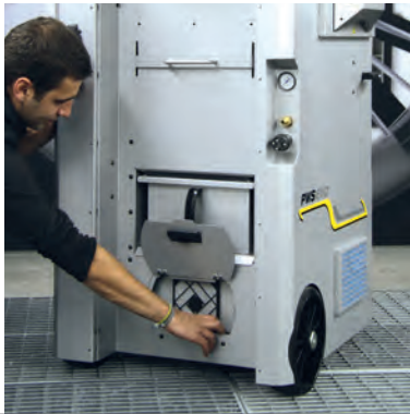
Wartungsklappe für die Filterreinigung der Turbine